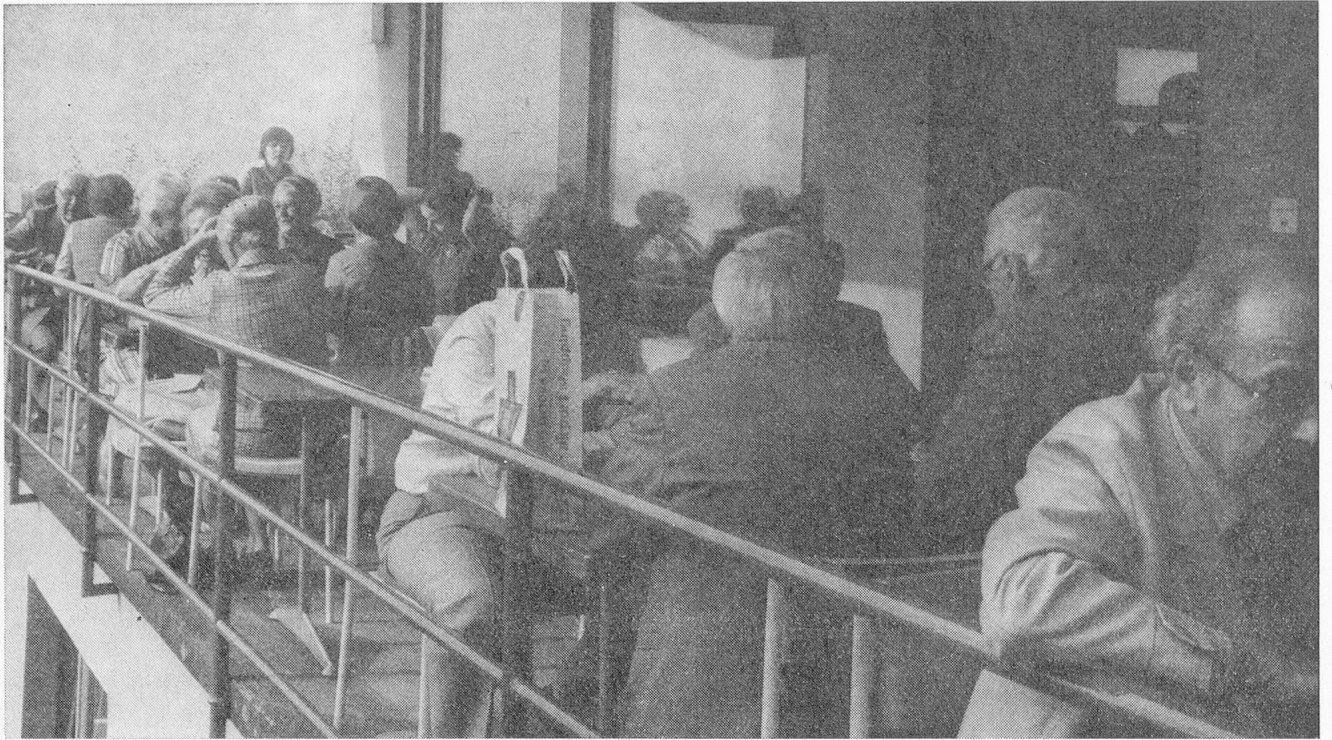
Alles hat ein Ende, nur die Wurst hat zwei: Das Veteranen-Treffen ist ausgeläutet; vor dem Abschied sitzen die Teilnehmer noch eine kurze Weile zusammen: Werden wir uns nächstes Jahr wieder sehen?

dauerte eine knappe halbe Stunde: Die prachtvollen Aufnahmen und die informativen Texte (gesprochen von Rosemarie Pfluger) kamen gut an, vielen Dank.