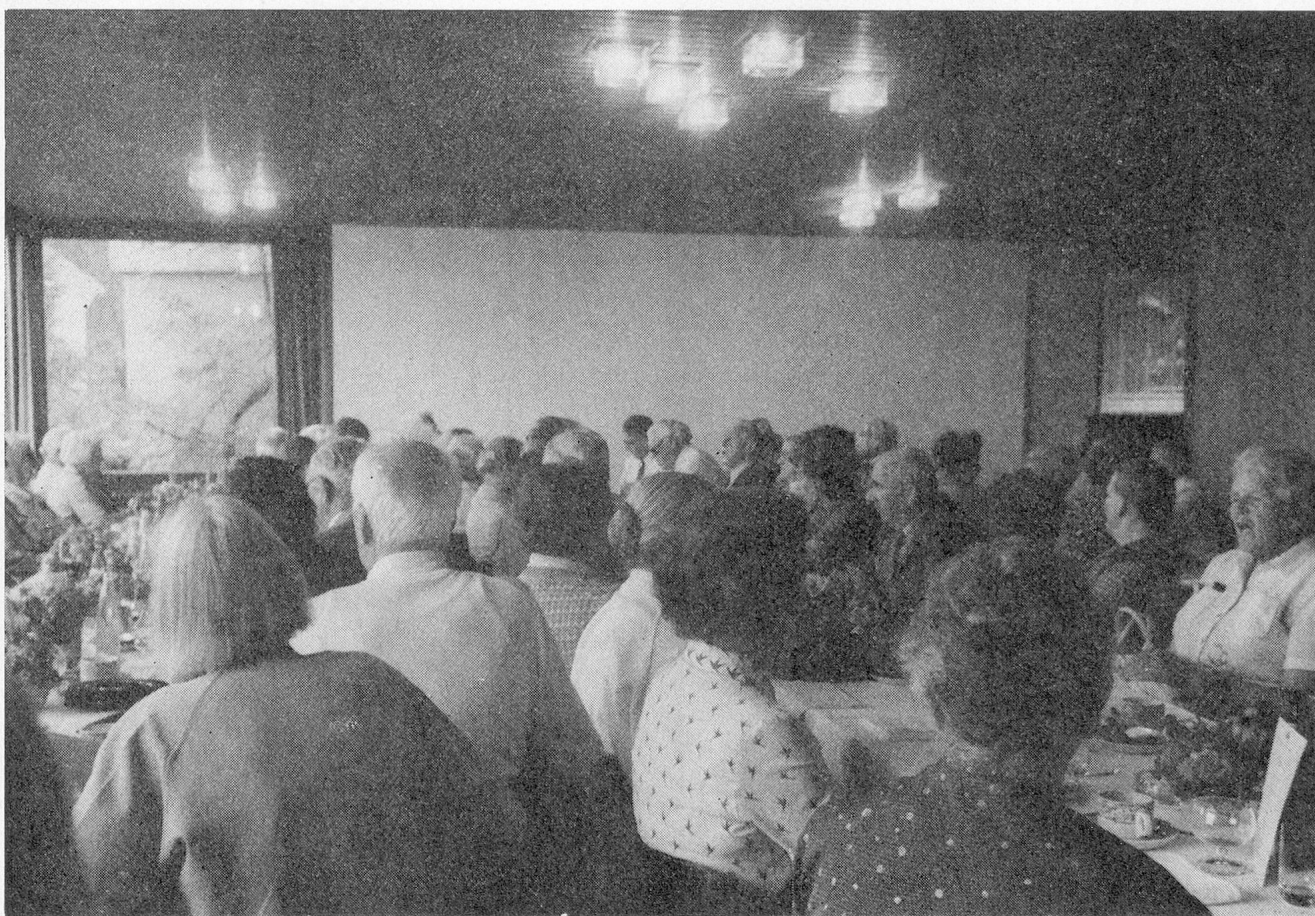
Rund 50 Jahre Geschichte und Entwicklung des schweizerischen Heimwesens sind im Hotel Guggital sichtbar anwesend: 90 Personen nehmen am diesjährigen Treffen der VSA-Veteranen in Zug teil.

Die Menükarte bewies, dass sich das OK aus lauter Gourmets zusammensetzt. Solange dieses Komitee bei der Stange bleibt und fleissig alle einschlägigen Werke der Kochkunst studiert, dürfen sich auch die Leute vom VSA-Sekretariat freuen, weil sie die Ge-