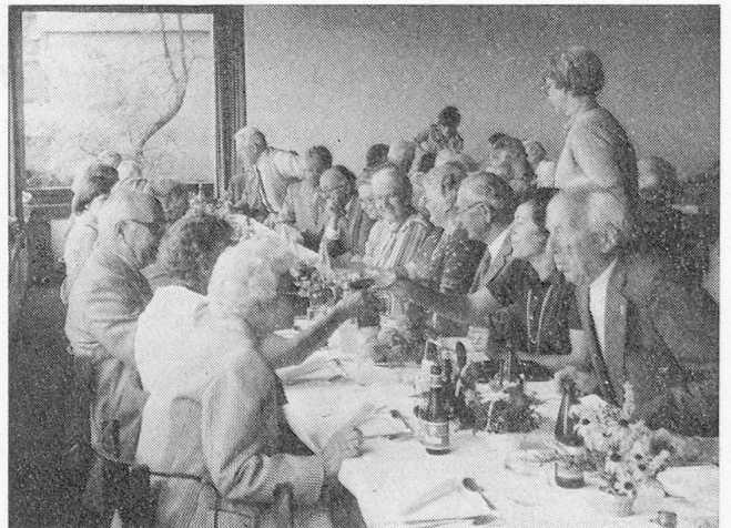
Solange das OK fleissig alle einschlägigen Werke der Kochkunst studiert, brauchen die VSA-Veteranen weder Hunger noch Durst zu leiden.