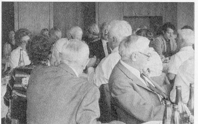
Zusammenkunft fortan jedes Jahr im Nachsommer, um alte Freundschaften aufzufrischen und neue anzuknüpfen.