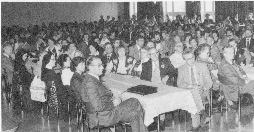
350 VSA-Leute bilden ein aufmerksames Auditorium im Festsaal des «Schützengartens».

Wer so denkt, wie Améry, vermag den Gedanken, dass das Leben ein Sterben sei, beides ineinander unauflösbar verzahnt, auf die Dauer nicht auszuhalten. Wer ohne Hoffnung lebt, weil sie — nicht «denkbar», nicht machbar, nicht jederzeit verfügbar — ihm auch nicht sicher genug ist, muss in der Formulierung «Mit dem Sterben leben» eine Obszönität sehen, gegen die er nur revoltieren kann. Wer auf Autonomie erpicht ist, weil sein Anspruch auf Würde danach verlangt, kann an das Sterben nur als das Sterben der anderen denken, denn sein eigenes bleibt ihm «unwirkliche Wirklichkeit», letzte Absurdität des Lebens, vor welcher er resignieren und kapitulieren muss. Jean-Paul Sartre, der im Menschen «une passion inutile», sah, sagte einmal: «Le faux, c'est la mort.» Ist es ein Zufall, dass Jean Améry, ein Zeitgenosse Sartres, in der Anonymität eines Hotelzimmers den Freitod gewählt hat?