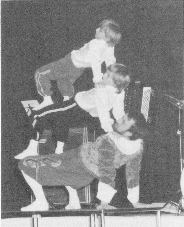
Besonders herzlichen Beifall ernten die Drei Musketiere von Widnau.