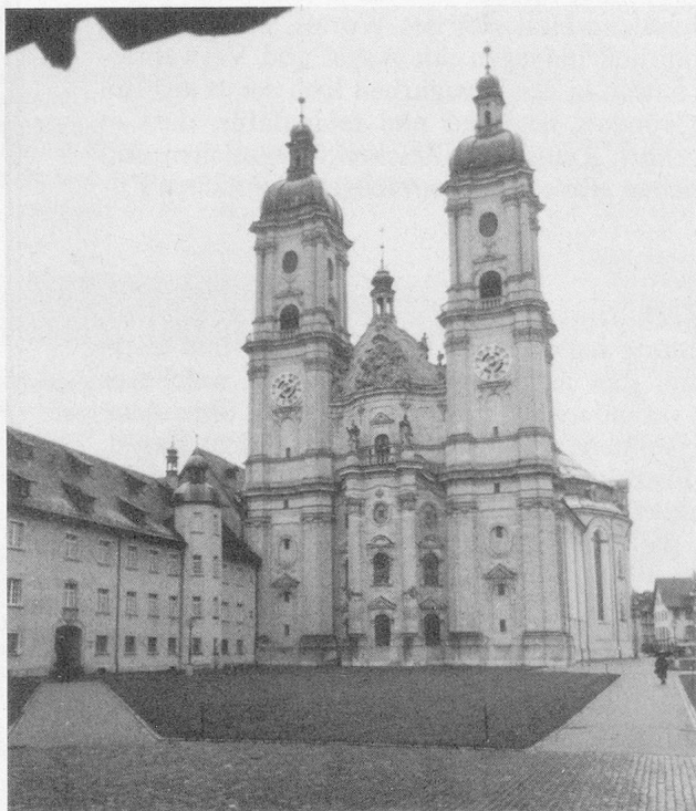
St. Gallens Wahrzeichen