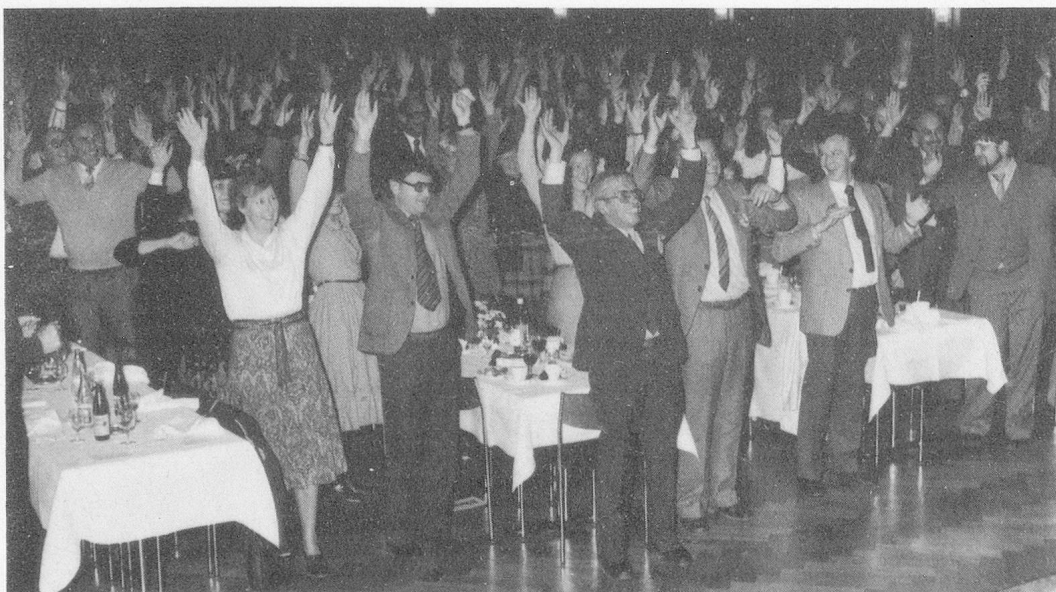
Wer rastet, der rostet und setzt Speck an, drum gibt's gymnastische Uebungen mit flotter Musik.

Mindestens 350 Personen folgten im Kongresshaus «Schützengarten» der Vorführung des Films «Noch 16 Tage» aus der Londoner Sterbeklinik St. Christopher und den fünf Vorträgen mit grosser Aufmerksamkeit. Verschiedene Teilnehmer erklärten mir spontan bei der Abreise, sie könnten voll guter Eindrücke und mit neuem Mut zu ihrer Arbeit ins Heim zurückkehren. Ich glaube, dass die St. Galler Fort-