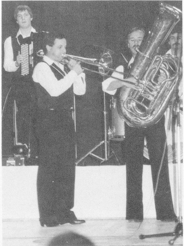
Die fidelen Stegreif-Musikanten St. Georgen.

ganz nach den Mustern des in der modernen Sozialarbeit gängigen Professionalismus zusammengestellt worden war. Um es kurz zu machen: Der sterbende Mensch erschien in den Vorträgen nicht als Objekt versierter Betreuungstechniker, und sein Sterben blieb ein menschliches Sterben. Was wünscht sich ein Mensch wohl am innigsten, der dem Tod entgegengeht? Klaus Dörig, Seelsorger am Kantonsspital St. Gallen, formulierte diesen Wunsch so: «Ich möchte an der Hand eines Menschen sterben!» Wie üblich, werden die St. Galler Vorträge im VSA-Fachblatt «Schweizer Heimwesen» abgedruckt werden.