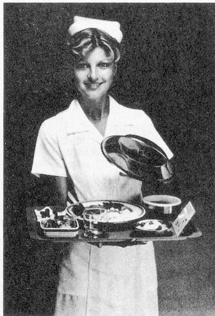
Neue Ideen für die traditionelle Speisenverteilung bei Berndorf Luzern AG

Unter dem Motto «Neue Ideen für die traditionelle Speisenverteilung» präsentiert Berndorf Luzern seine unverwechselbaren Spezialitäten für Spitäler, Heime und Kollektivhaushalte. Sie alle wurden für den strapaziösen Alltag mit kompetenten Fachleuten der Speisenverteilung und in engster und ständiger Zusammenarbeit mit spezialisierten Produzenten entwickelt. Caldomet Speisenverteilanlagen, Multimet Kantinen- und Heimverpflegungssystem, Marken-Hotelporzellan von Gebrüder Bauscher und Schönwald, Libbey Gastronomiegläser und vieles andere sind die echten Schlüssel für Speisenverteilung in rationalster Form.