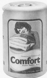
comfort Der bewährte Gewebeerwecker. Reduziert die statische Aufladung bei Mischgeweben.