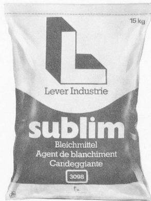
sublim Bleichmittel auf Sauerstoffbasis. Für stärker befleckte Wäsche.