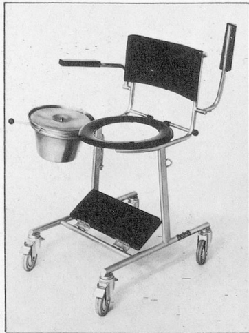
Klosettrollstuhl Mod. 49, Fussbrett, WC-Brille und Topfhalter wegnehmbar. Kann über Klosomat gefahren werden.