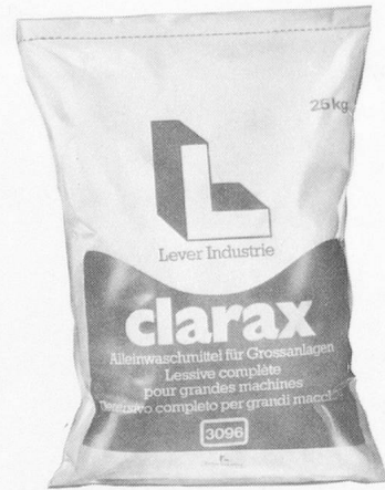
clarax Als Klarwaschmittel mit bio-verax, oder als Alleinwaschmittel für kontinuierliche Waschanlagen.