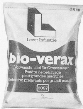
bio-verax Für schonende Entfernung hartnäckigster Flecken.