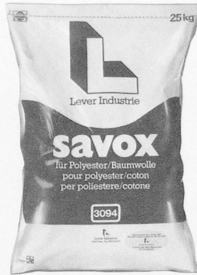
savox Spezialwaschmittel für Mischgewebe Polyester/Baumwolle.