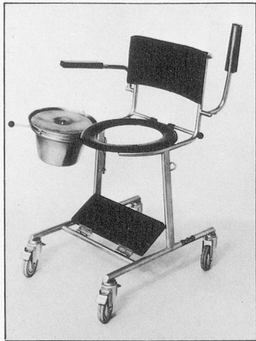
Klosettrollstuhl Mod. 49, Fussbrett, WC-Brille und Topfhalter wegnehmbar. Kann über Klosomat gefahren werden.