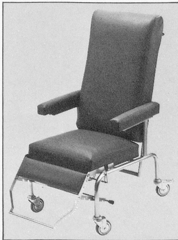
Patientenfauteuil A/0176S, Armlehnen aufklappbar, Verstellautomatik, Kunstlederbezug, verchromt mit 100 mm Lenkrollen, Fussraster fünffach verstellbar.