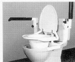
Messerli-Toilettenhilfe Ausführung wie Messerli-Toilettenstütze, jedoch Sitzhöhe in Stufen verstellbar bis 18 cm, einfache Montage durch die bestehenden Lochungen der Sitzbrille.