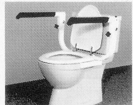
Messerli-Toilettenstütze Passend auf alle Toilettentypen, Armstützen beidseitig zum Hochklappen, höhenverstellbare Armlehnen, einfache Montage durch die bestehenden Sitzbrillenlochungen.