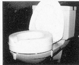
Sitzerhöhung Modell DERBY Passend auf alle Toilettentypen, Sitzerhöhung 14 cm, Kunststoff. In unserem Angebot finden Sie weitere einfache Toiletten-Sitzerhöhungen.