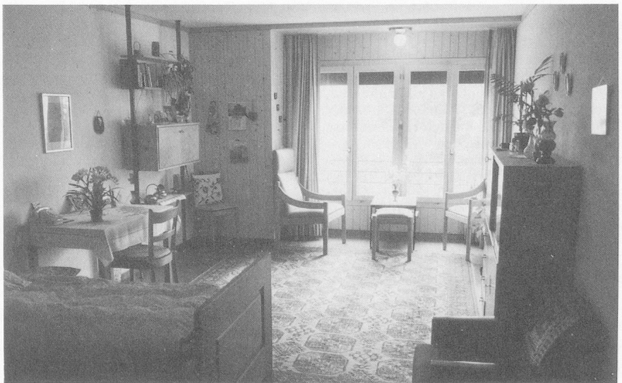
Jedes Pensionärzimmer wirkt durch die individuelle Ausstattung wieder ganz anders. Und trotzdem: Vieles Liebgewonnene musste zurückgelassen werden.