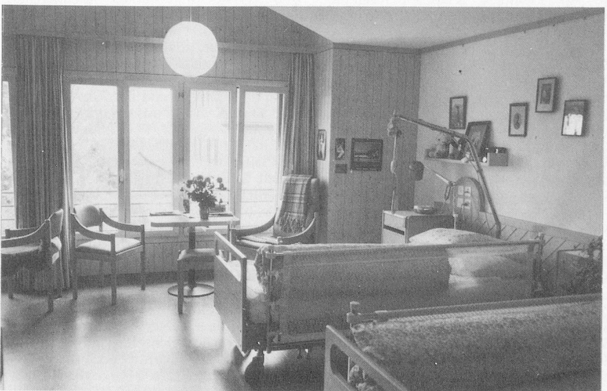
Im Pflegezimmer wurde darauf geachtet, dass auch vom Bett aus die Sicht ins Grüne gewährleistet ist.