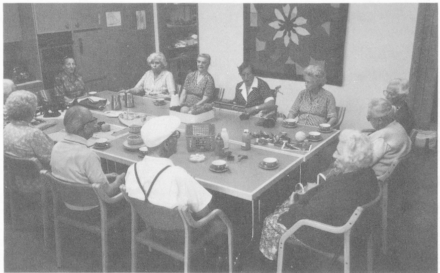
Der Beschäftigungsraum mit dem selbstgefertigten Wandbehang im Hintergrund.