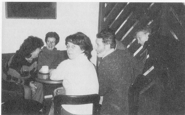
Kaffeepausen in einer Pause – bitte nicht stören!

Geduld hat mit Dulden und Leiden zu tun. Aber auch mit jener Wachheit und mit jener gelassenen Aufmerksamkeit, die man früher dem Indianer auf der Jagd nachgesagt hat. Sie hat auch zu tun mit Zuversicht, mit Vertrauen und mit der Bereitschaft, im rechten Augenblick zu handeln. Die Ungeduld als Kummerform und als Zeichen des Mangels muss ebenfalls bedacht sein. Wie sich der Ungeduld das Misstrauen und, hieraus abgeleitet, das Bedürfnis nach Sicherheit zuordnen lässt, so gehören Geduld und Vertrauen zusammen. «Die Übel in der Welt haben ihren Ursprung in der Ungeduld» und im Misstrauen. Der schöne Aphorismus, Geduld sei «der lange Atem der Leidenschaft», gewinnt noch schärfere Konturen, wenn ihm der Satz folgt, dass nur derjenige geduldig sein kann, welcher der Leidenschaft fähig ist. Der Ungeduldige ist