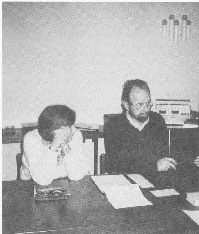
Zum Berufensein gehört das Scheiternmüssen: «Was sagt der Psychotherapeut dazu?»