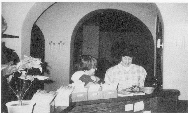
In der Probstei Wislikofen wie gute alte Bekannte in Empfang genommen und am Schluss wie solche verabschiedet.