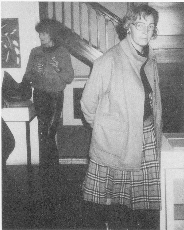
Die Bilder von Rainer Kunz sind von einer erstaunlichen Farbigkeit. Man sieht sie sich gerne mehrmals an.

Vorlesung am Vormittag und der Galerie-Besuch am Nachmittag waren ein denkwürdiges Ereignis! Noch nie ist mir so deutlich aufgegangen, wie unverzichtbar, aber