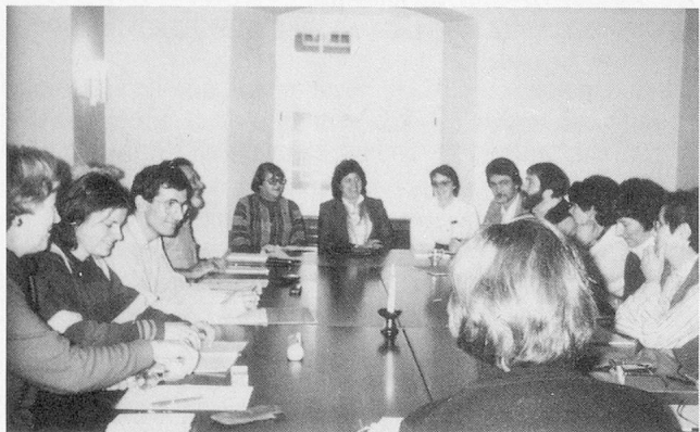
Ist die Geduld der «Schlüssel zur Freude» oder ist sie nur «für Memmen gut»?

Was nun kommt, ist kein resümierender, mit ein paar Helgen angereicherter Bericht, noch weniger ein Kommentar und schon gar nicht eine «Auswertung», sondern eher bloss eine kleine Folge «unzeitgemässer Betrachtungen» rund um die Frage, wieso die Geduld ein – heute nicht sehr gefragtes – Wagnis sein soll. Jede(r) wünscht sich