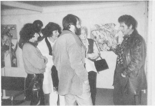
Besuch in der Galerie Bommer in Zug: Der Maler kann sich der Fragen kaum erwehren.

Vorlesung am Vormittag und der Galerie-Besuch am Nachmittag waren ein denkwürdiges Ereignis! Noch nie ist mir so deutlich aufgegangen, wie unverzichtbar, aber