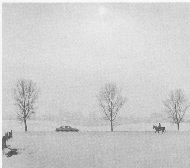
Begegnung im Winter: Auto – Pferd.