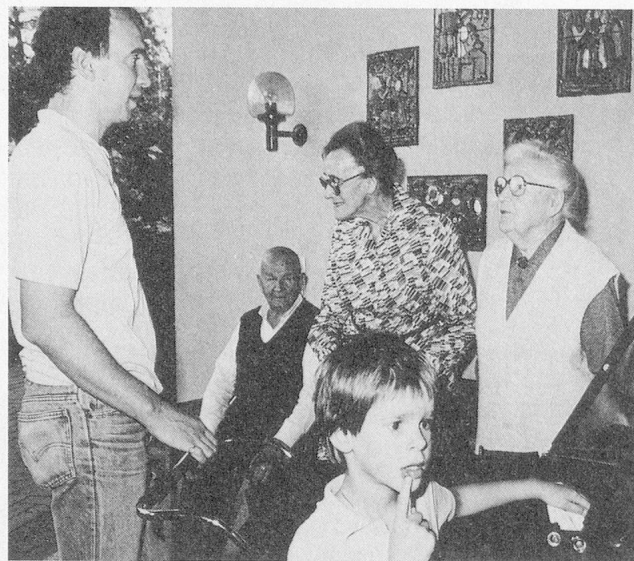
Gespräch zwischen den Generationen. (Altersunterschied 92 Jahre)