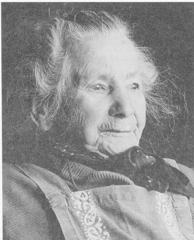
Trotz ihrer 92 Lenze ist diese Pensionärin schlagfertig und weiss, was sie will.