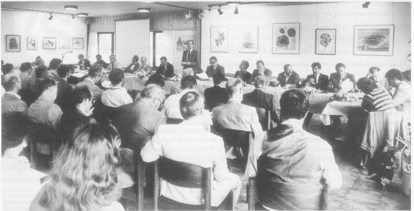
Eine speditive Delegiertenversammlung: Der Gesamtvorstand stellte sich den «spärlichen» Fragen der Delegierten.