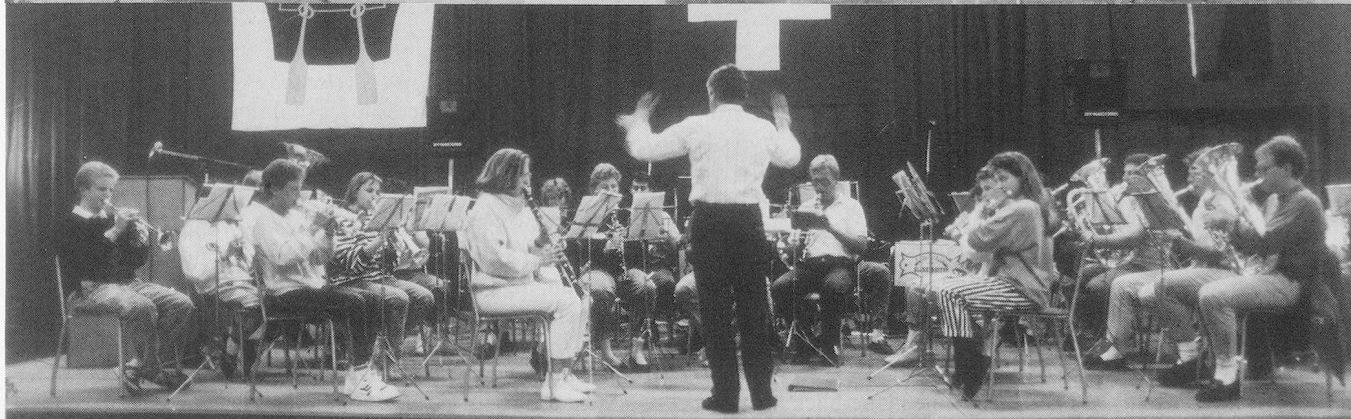
Jugend in musikalischer Aktion: Die Kinder der «Linthkolonie» eröffneten die Tagung mit der Kindersymphonie von Haydn; die Jugendmusik der Region war für die abendliche Tafelmusik besorgt.