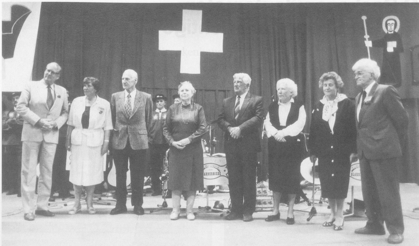
Ehrungen: Ihnen allen gebührt Dank und Anerkennung für lange Jahre treue Dienste im Heim.