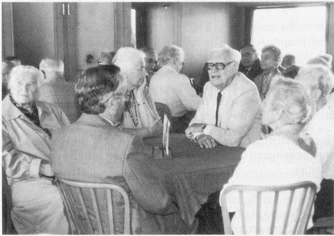
Warten auf den Kafi: Nach der zum Teil langen Anreise wartete auf dem Schiff «männiglich» auf die erste Runde Kaffee.