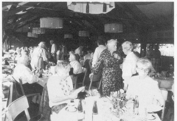
«Weisst Du noch?» Breiter Raum gehörte dem Austausch von Erinnerungen.

dem dem stimmkräftigen Chor liess sich hören. Die Anwesenden verdankten den Kindern ihr Konzert mit verdientem, herzlichem Applaus.