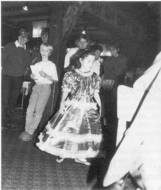
Musikalische Überraschung: Ein Tänzchen in Ehren . . . die Kinder des Pestalozziheims Redlikon brachten musikalische Grüsse. Danke schön!