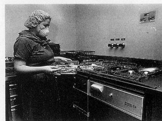
Miele Thermodesinfektor in der Chirurgie.

W er einmal auf einer Intensivstation war, weiss wie aufwendig die Pflege von Intensivpatienten ist. Denn nach einer Operation ist der Patient oft nicht gleich wieder auf den Beinen. Zur aufopfernden Pflege gehört im Spital eine umfassende Infrastruktur, ohne die die Arbeit der Ärzte und Pfleger nicht möglich wäre: sauber sterilisierte Operationsbestecke, desinfizierte Beatmungsgeräte, Tubusse usw.