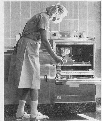
Miele Thermo-Desinfektor in der Chirurgischen Klinik des Universitätskinderspitals Zürich

D ie Chirurgische Klinik des Universitätskinderspitals Zürich verfügt über das einzige schweizerische Zentrum zur Behandlung brandverletzter Kinder. Jährlich werden hier etwa 100 Kinder mit schweren Verbrühungen und Verbrennungen behandelt.