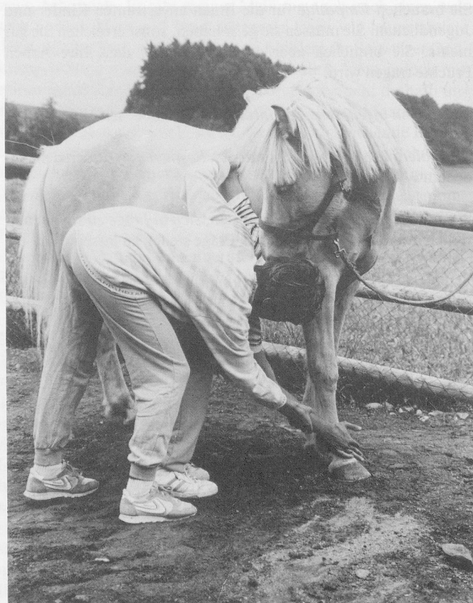
Das Pferd und ich: Ich spüre Deine Gestalt . . .

1985 wurde die Schweizerische Vereinigung für Heilpädagogisches Reiten und Voltigieren (SV-HPR) aus der Taufe gehoben. Ihr Ziel ist die Verbreitung der HPR und ihre Aufgabe, die Durchführung von Ausbildungslehrgängen. Inzwischen haben fast 100 Fachkräfte die Ausbildung zum diplomierten Reitpädagogen SV-HPR abgeschlossen, ebenso viele stecken mittendrin. Die Absolventen sind Pädagogen aus Deutschland, Österreich, Luxemburg, Finnland und der Schweiz . Sie arbeiten in Heimen, psychiatrischen Kliniken, heilpädagogischen Tagesschulen, auf Jugendfarmen und privaten (heilpädagogischen) Reitbetrieben .