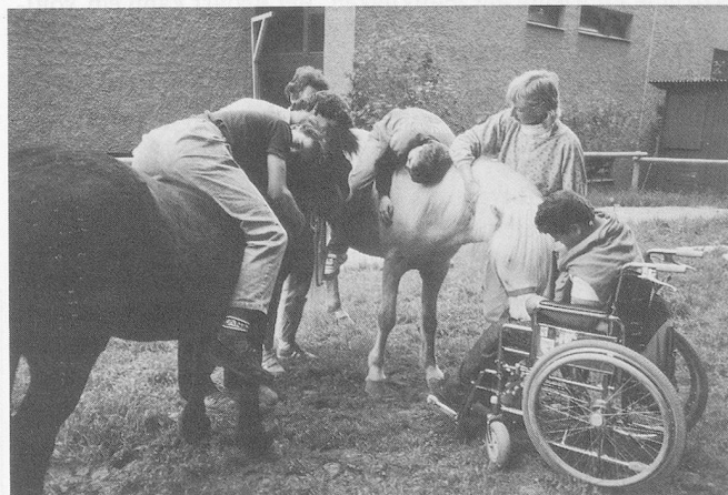
... Du bist so gut

Es geht hier in erster Linie um den erzieherischen Wert einer regelmässigen Beschäftigung mit dem Pony. Einem grossen Teil unserer Kinder fehlt die Beziehung zur Natur und damit auch der Einblick in den Lebenszyklus lebendiger Organismen. Damit fehlt ihnen auch die Möglichkeit, Fütterung und Pflege eines abhängigen Lebewesens als natürliche, selbstverständliche Vorgänge zu erleben und zu erlernen und die Verantwortung gegenüber