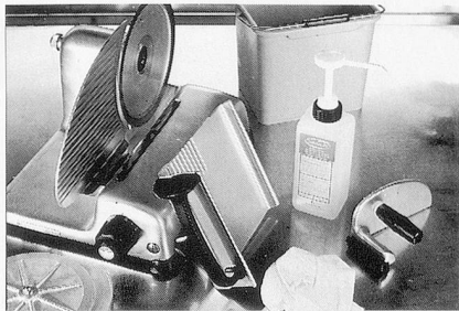
Sumanet, Sumabac, Sumarein: Alles für hygienisch-saubere Küchenmaschinen.