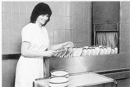
Glänzendes Ergebnis beim Geschirr: Sumazon und Sumabrite.