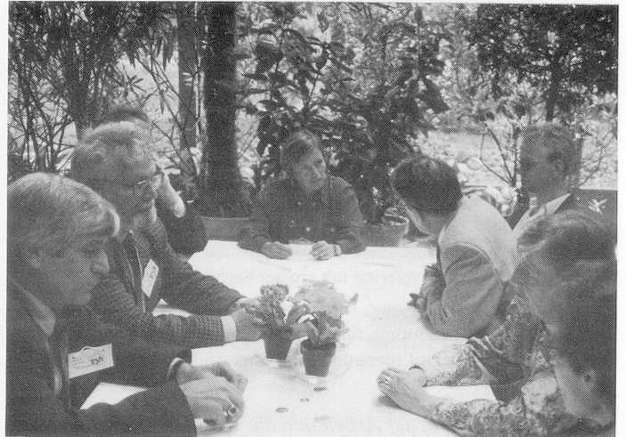
Ein Kaffee vor Tagungsbeginn befreit die Gemüter; kleine Diskussionsgruppen fördern die Kollegialität und verhelfen zu erfreulichen Fachgesprächen.