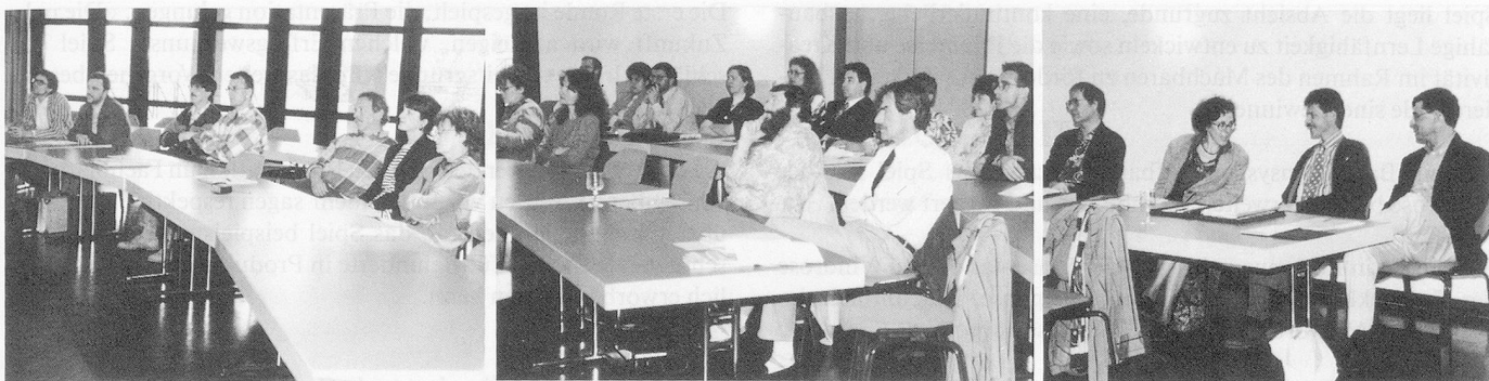
Gespannte Zuhörerrunde während der Projektpräsentation.