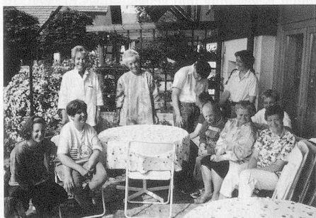
Gruppenbild: fast die gesamte Equipe der Alten Schmitte. So bodenständig wie der Alltag der Menschen, die hier leben – die Alte Schmitte im Dorfkern Lohns.