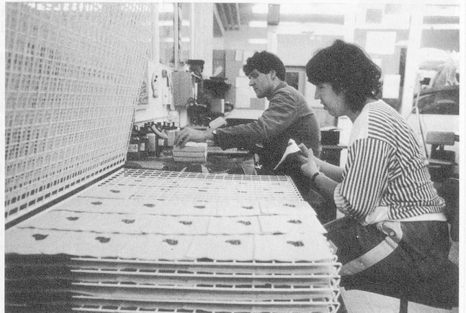
Geschützte Werkstätte . . . Beschäftigungs- und Fördergruppen.

Den Verantwortlichen der Werkstätte und der Stiftung stellt sich gegenwärtig eine neue, grosse Herausforderung: Weil der überwiegende Teil der behinderten Mitarbeiter bei den Eltern wohnt und sich altersmässig in der Bandbreite 30 bis 40 Jahre befindet, wird in absehbarer Zeit die Frage nach der künftigen Wohnform akut. Deshalb hat die RGZ-Stiftung beschlossen, ein Wohnheim für ihre behinderten Mitarbeiter zu errichten.