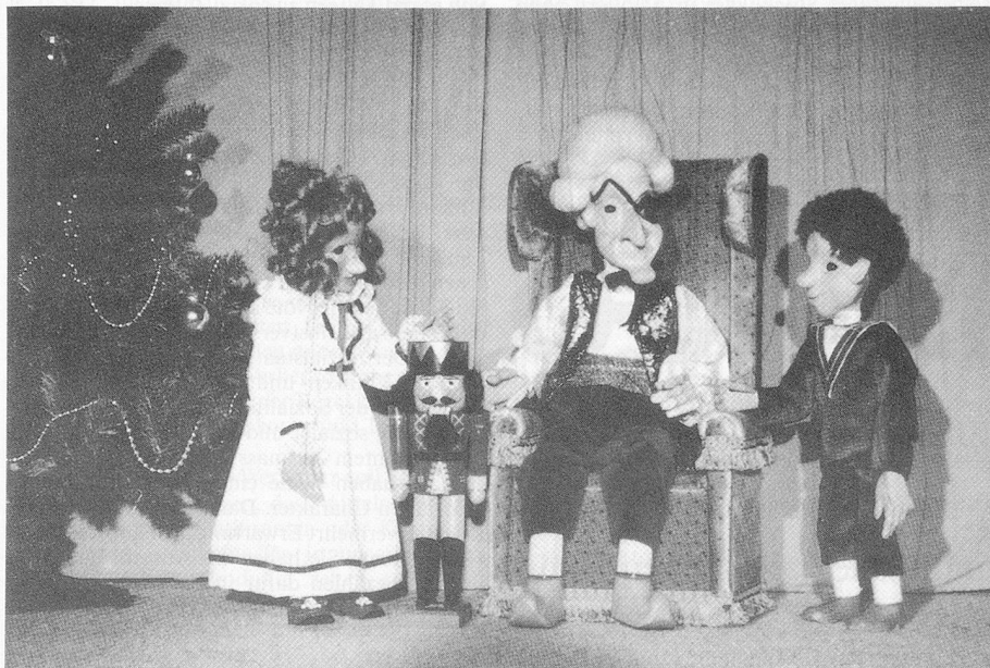
Szenenbild aus der Marionetten-Produktion «Nussknacker»