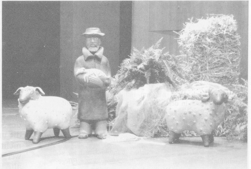
Allerliebste Dekorationen: Marionetten und Keramikfiguren erzielten mit wenig Aufwand eine starke Wirkung.

Thun ist immer eine Reise wert. Geniessen Sie diese Stadt mit ihren Kunstdenkmälern, verbunden mit der angestrebten Weiterbildung, dann werden Sie beim Abschied mit Freuden sagen: ‚Uf Wiederluege‘ und das auch im Sinne einer gleichberechtigten Zusammenarbeit zwischen Heimverband Schweiz und dem Verein Bernischer Alterseinrichtungen.›