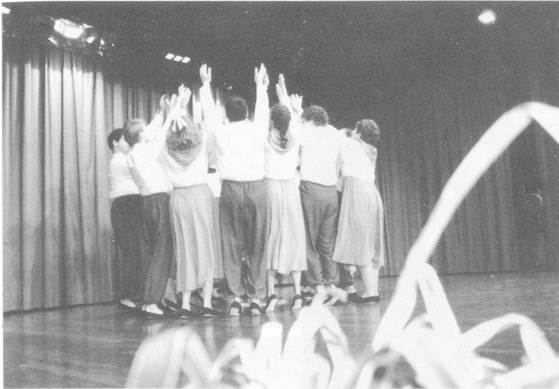
Bunter Abend: die Gehörlosentanzgruppe der Stiftung Uetendorfberg; Cabaret: witzig, kräftig und sanft, besinnlich.