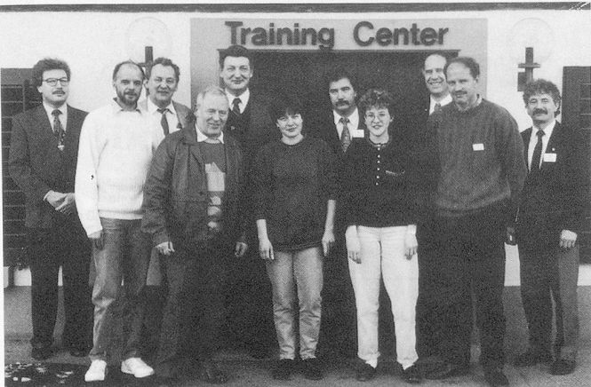
Gruppenbild. Die Diplomanden freuen sich mit einigen Experten über den erfolgreichen Abschluss ihrer intensiven Ausbildung bei Lever Sutter AG, Münchwilen.

Am 26. 2. 1993 absolvierten sieben Kandidatinnen und Kandidaten die Prüfung zum Diplomabschluss als ausgewiesene Fachkraft für Hygiene, Reinigung und Werterhaltung. Den recht hohen Anforderungen waren sechs Absolventen gewachsen und bestanden sie mit Erfolg. Dies war bereits der 19. Diplomtag, den die Firma Lever Sutter AG seit der Premiere im Jahre 1986 durchführen konnte.