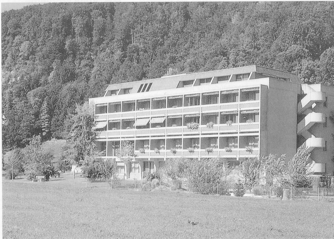
Das «Feriendomizil»: Alters- und Pflegeheim Fluematte, Dagmersellen.

Einige Tage nach Abschluss der Übung führten wir mit dem Personal eine Manöverkritik durch, damit eventuelle Fehler beim nächsten Mal vermieden werden können. Grundsätzlich sollen die MitarbeiterInnen den Umzug als positives Erlebnis in Erinnerung behalten. Deshalb ist auch an Lob nicht zu sparen. Ein festlicher Anlass als Dank für das Mitdenken und Mitarbeiten wäre zumindest angezeigt.