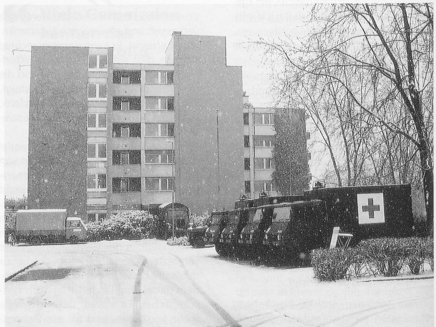
Umzugsbeginn in Aarburg, Wagenpark der Armee. Links oben ist das Baugespann für die Südfassade zu sehen.