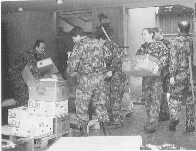
Möglichst viel wird mit Schachteln und Paletten an den richtigen Ort verfrachtet.

Bei der Übernahme wird zudem eine Mängel- und eine Inventarliste zu erstellen sein.