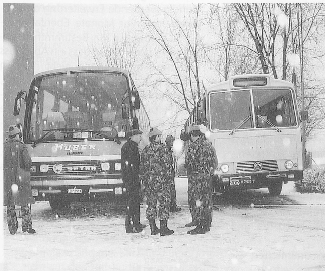
März 1993: Rollstuhlar und Nostalgiebus der Schweizer Armee stehen für den Ausflug bereit – bei Schneegestöber ...

Viele Pensionäre finden sich nicht ohne weiteres in den neuen Gefilden zurecht. Andauernde Motivation und viel Zeit zur Begleitung sind nötig. Gute Beschriftung aller Räume und Anlagen hilft viel mit. An jede Zimmertüre hängten wir zusätzlich zu einem Namensschild einen persönlichen Gegenstand des Bewohners/der Bewohnerin, damit der Raum eher gefunden werden konnte. Als Bestandteil des Umzuges setzten wir eine Equipe des Zivilschutzes für die Einrichtung der Zimmer ein: Möbel schieben, Verkabelungen vornehmen, Bilder aufhängen. Sobald das geschehen war, fühlten sich die Betagten schon viel wohler. Der Fernseh- und Telefoninstallateur ist sehr rasch aufzubieten, damit die alten Gewohnheiten nicht allzulange aufgegeben werden müssen. Der Bestandteil an Pflege- und Betreuungspersonal ist zumindest anfänglich möglichst auszubauen. Viele Probleme können durch intensive Begleitung der BewohnerInnen schnell gelöst oder sogar vermieden werden.