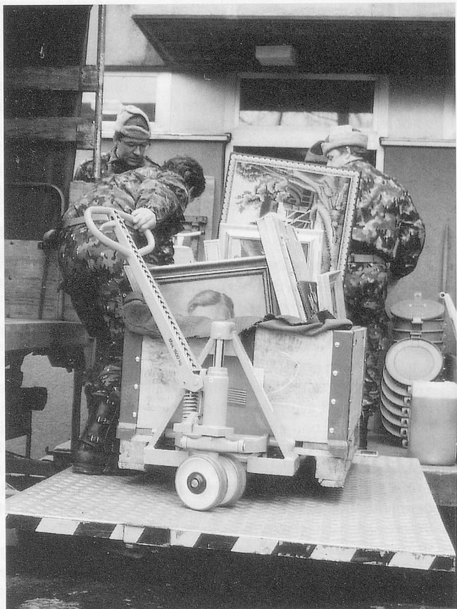
Ganze Palettenrahmen werden mit Bildern gefüllt.