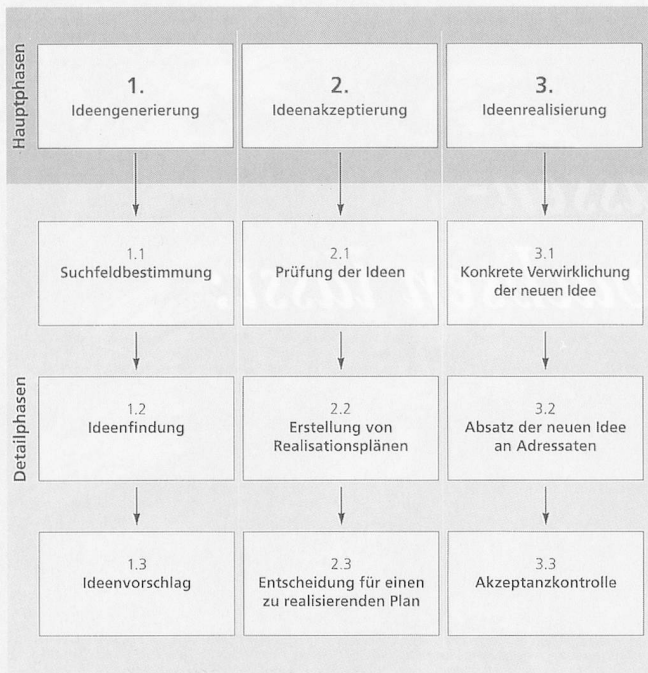
Abbildung 2: Phasen des Innovationsprozesses

erhöhen die Attraktivität einer Institution auf dem Arbeitsmarkt.