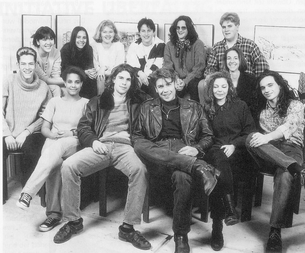
Am Projekt «Liebe, Sex und Aids», das für Jugendliche bestimmt ist, sind Jugendliche inhaltlich massgeblich beteiligt.

Bei Bedarf können für diese Veranstaltungen auch Fachleute sowie betroffene Menschen zugezogen werden. Das Projekt läuft zirka 18 Monate und kostet insgesamt zirka 750 000 Franken. ■