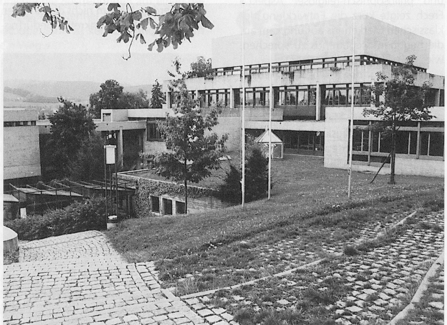
Hochschule St. Gallen: Wirtschaftliches Denken im passenden äusseren Rahmen.