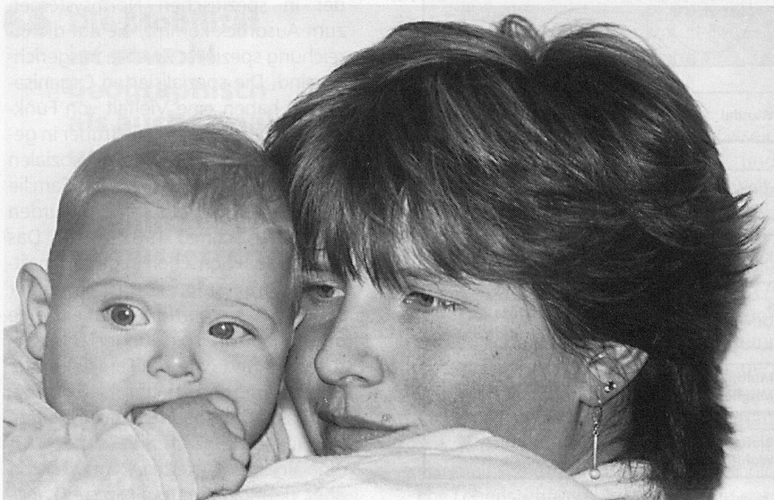
Folgt die Frau dem traditionellen Rollenbild oder nicht?

Das Problem der Spannung zwischen verschiedenen Systemen sei – ehe die theoretischen Ausführungen fortgesetzt werden – an einem Beispiel erläutert: die Struktur der Wirtschaft stellt bekanntlich prinzipiell auf Beschäftigte ab, die insofern «kinderlos» sind, als Kinder und die Fürsorge dafür einem anderen gesellschaftlichen Subsystem – der Familie – überlassen bleiben. Folgt eine Frau also nicht dem traditionellen Rollenmodell und ist neben dem Manne erwerbstätig,