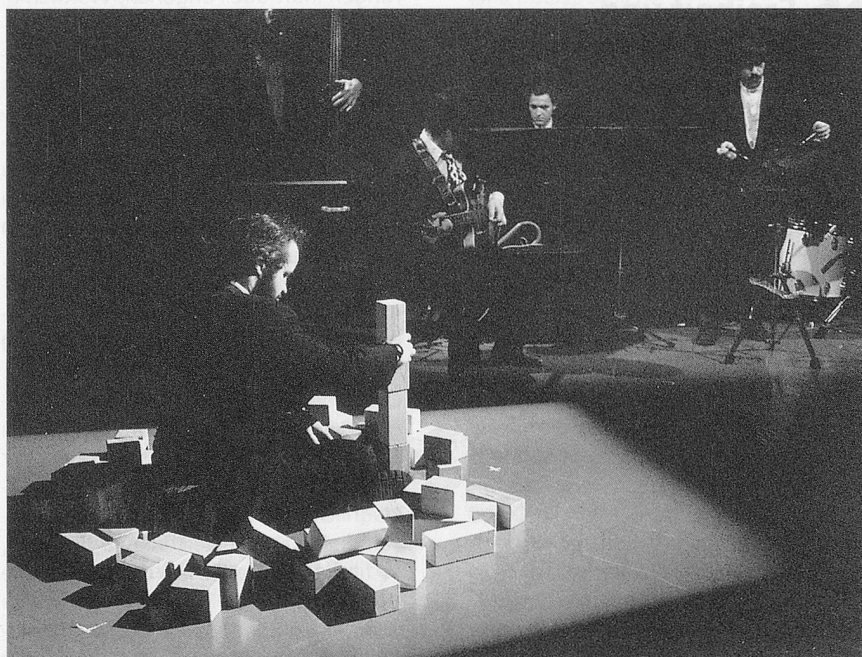
Und auch wenn der Freiheitsraum noch so klein ist, so hat er doch Bedeutung für das Wohlbefinden.

am Normbereich orientiert, macht den Behinderten zum Idioten. Auch die Heilpädagogik, lange defektorientiert, auf Reparaturmassnahmen angelegt – alles ist machbar –, trug bei zur Aussonderung des Behinderten aus der Bürgerwelt in die Idiotenwelt. Nur über ein verändertes Menschenbild, das auch Menschen mit schwerer Behinderung einschliesst, in dem Bürger und Idiot identisch sind, wird echte Integration möglich. Menschenleben, so Professor Hahn, «ist wesentlich gekennzeichnet durch permanente selbstbestimmte – nicht instinktgesteuerte – Einflussnahme auf das eigene Wohlbefinden». Diese Einflussnahme findet sich bei jedem Menschen, ob mit oder ohne Behinderung. Für Karl Jaspers ist diese Möglichkeit des Menschen, Freiheit zu verwirklichen, der Grund der menschlichen Existenz. Das