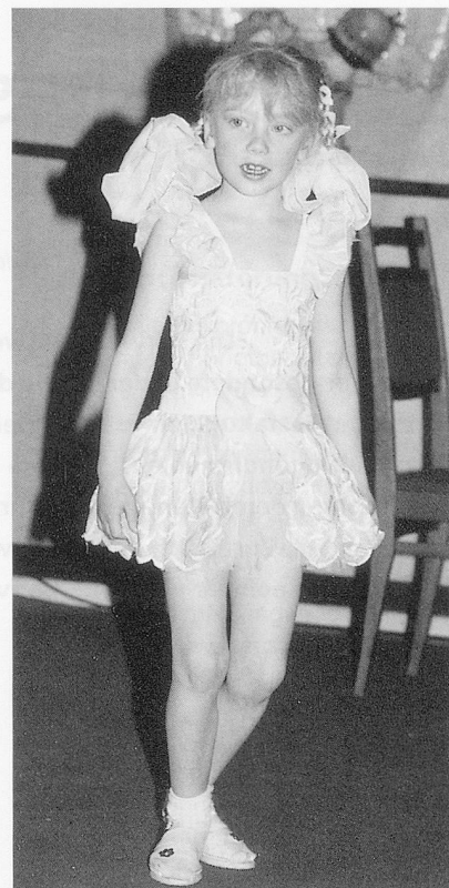
Musische Erziehung.