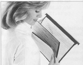
Pflegedokumentations-Systeme und Krankengeschichten