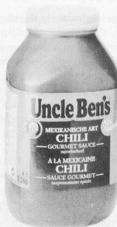
Uncle-Ben's-Sauce Minute «Chili»: Temperamentvoll wie die Natur Mexikos.

Elro-Werke AG Wohlerstrasse 47 5620 Bremgarten Telefon 057 3091 11