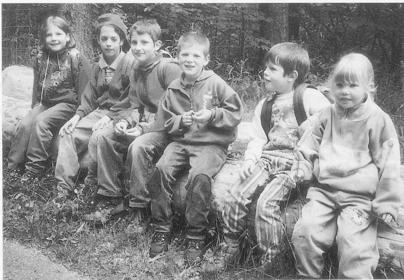
Heimleiter-nachwuchs an der ZHV-Wanderung.

ten und Trollblumen aus den blühenden Magerwiesen anguckten.