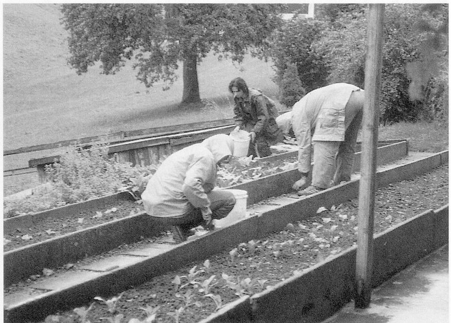
Arbeit im Regen... aber sie werden nicht im Regen stehengelassen.