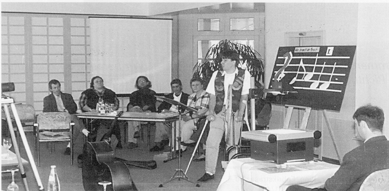
«Was braucht der Mensch?» – Aus der Präsentation der Projektarbeit der Gruppe 2.