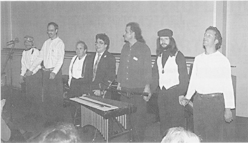
Applaus für DIE REGIERUNG.