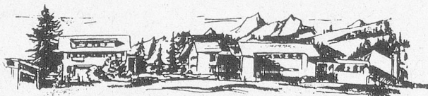
Kinderheim TABOR, 3703 Aeschi bei Spiez

Telefonische Auskunft erteilt Ihnen gerne Herr U. Klopfenstein, Tel. 079 300 85 91 Die schriftliche Bewerbung mit den üblichen Unterlagen richten Sie bitte bis 28. Februar 1997 an: STIFTUNG BUBENBERG, z.H. Herrn U. Klopfenstein, Postfach 308, 3700 Spiez