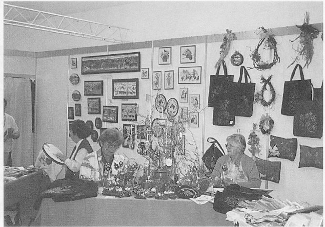
...aber auch das Senioren-Atelier mit Kunstwerken und Handarbeiten von Plusfünfzigern.