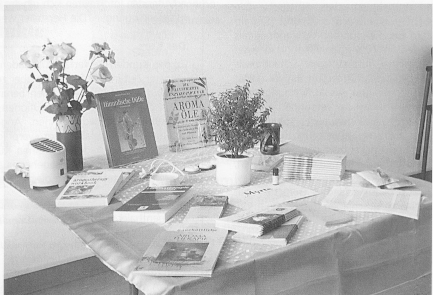
Einladender Tisch im Kurszimmer: Einschlägige Bücher, aromatische Pflanzen, Aromastream (links hinten), Duftkissen...