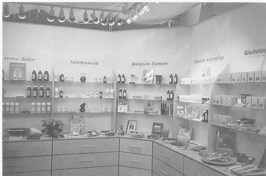
Wohltuende Düfte: Der Stand des farfalla-Duftladens an der OEKO & PARACELTUS-Messe in Zürich.

Während die medizinische Aromatherapie, wie französische Ärzte sie betreiben, in der Schweiz noch kaum praktiziert wird, beginnt die Aromapfle-