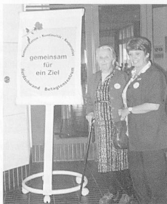
Qualitomania in der SSBL ISO-Norm 9001 für Schulheim Effingen

QAP für Alters- und Pflegeheime in Emmenbrücke, Pfäffikon und Aarburg