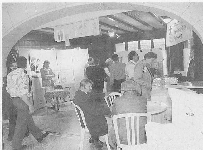
Die beiden Berufsverbände: Der «Berufsverband der Heimleiter und Heimleiterinnen» des Heimverbandes Schweiz und der «Berufsverband HeimleiterInnen Schweiz» (bhs).