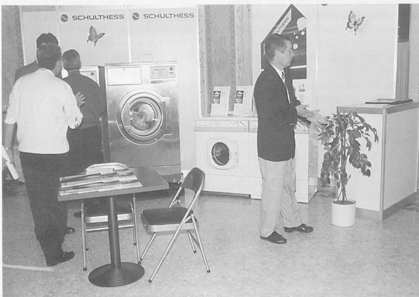
Beratung und Information für spezifische Probleme.

«Einer für alles», dies das Motto der Berndorf Luzern AG aus Littau: «Vom Verteilband über die Transportwägel zu den Tablettis und Clochen bis hin zum Porzellan, dem Besteck und den Gläsern», für jede Herausforderung in Sa-