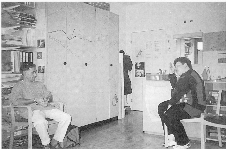
Das Verhör (man beachte die Handschellen!).

mit Körperarbeit, mit Wahrnehmung oder mit verschiedensten Formen der Theaterarbeit auseinandersetze.