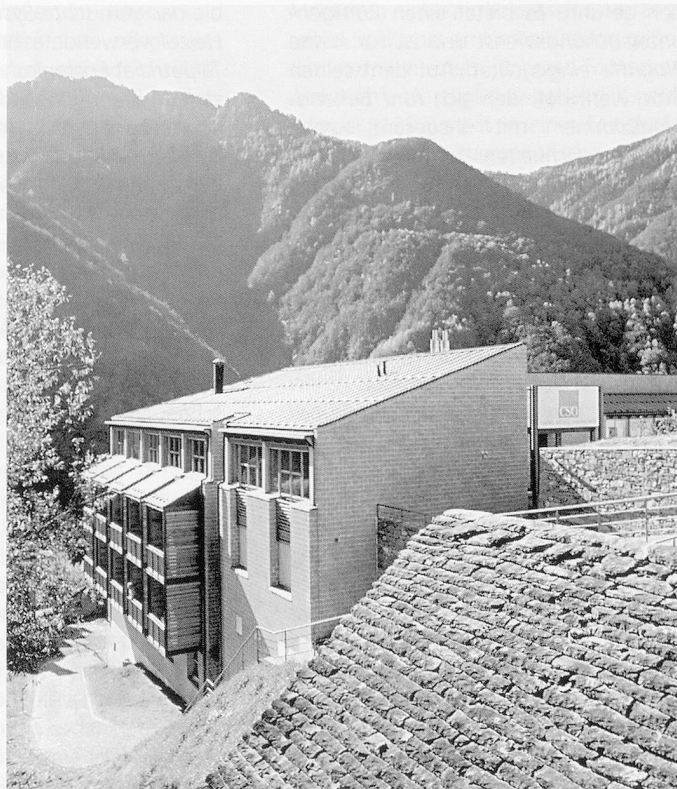
Mit Blick über das Tal: Das neue Sozialzentrum von Onsernone.

Die Sozialen Dienste integrieren das SZO in der Bevölkerung und brachten qualifizierte Arbeitsstellen ins Tal. In der schönen, hellen und funktionellen Küche werden die Mahlzeiten für die Hausgäste, das Personal, die Kinder und die Schullehrer vorbereitet: insgesamt wird für ungefähr hundert Perso-