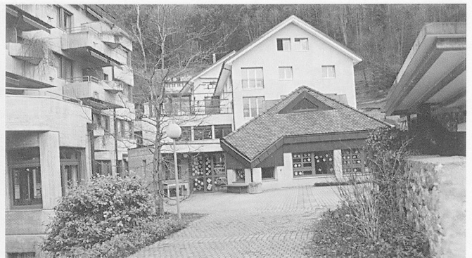
Januarhöck des ZHV im APH Rosenberg, Altdorf. Zum Altersheim-Gebäudekomplex gehört auch der Kindergarten, im Hintergrund (weiss) der neue Trakt...