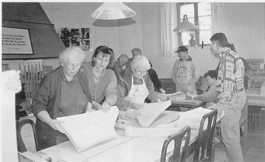
Workshop in der «Alten Schmitte».

Anmeldung/Auskünfte und Verkauf: Wanda Miescher, Moosstrasse 22, 4562 Biberist, Telefon/Fax 032 672 27 60. ■