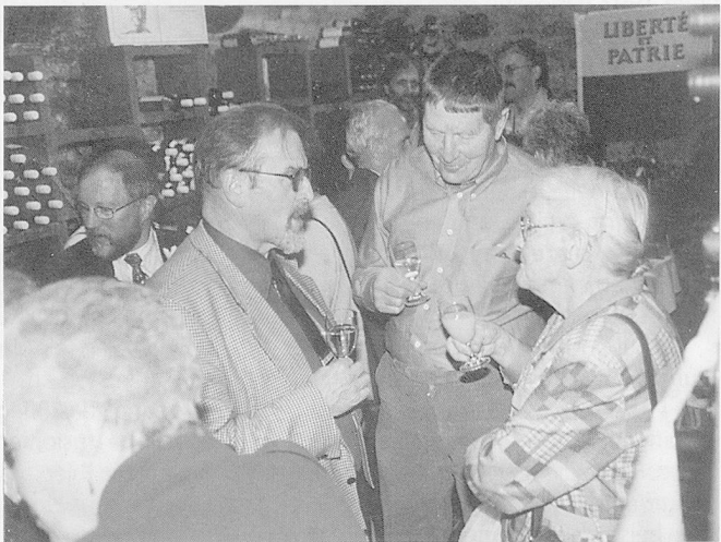
Gut besuchte Generalversammlung der Sektion Appenzellerland in Gais: Arbeit macht zwar auch Spass; aber andersrum ist's lustiger.