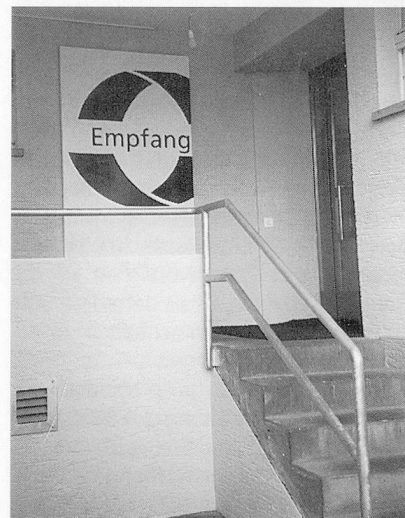
Eingang des Hauptsitzes der Stiftung für Behinderte Aarau-Lenzburg am Färberweg 2 in Lenzburg.