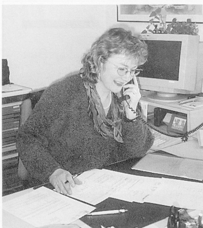
Die freundliche Stimme am Telefon...

interessant, die administrative Abwicklung und telefonische Rücksprachen, etwa mit Bereichsleitern der Institution oder mit der Pensionskasse, zu übernehmen: Um den Verantwortlichen «in die Hand» zu arbeiten, ist sie gefordert, mitzudenken und Zusammenhänge zu erkennen.