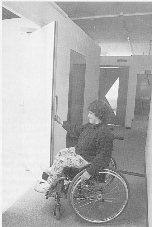
Eine Drehschiebetüre erleichtert dieser Rollstuhlfahrerin das Öffnen und Schliessen.

Die permanente Hilfsmittel- ausstellung Exma in Oensingen präsentiert sich rechtzeitig zu ihrem 15jährigen Bestehen in einem neuen Erscheinungsbild. Im März 1983 wurde die Exma, die inzwi-