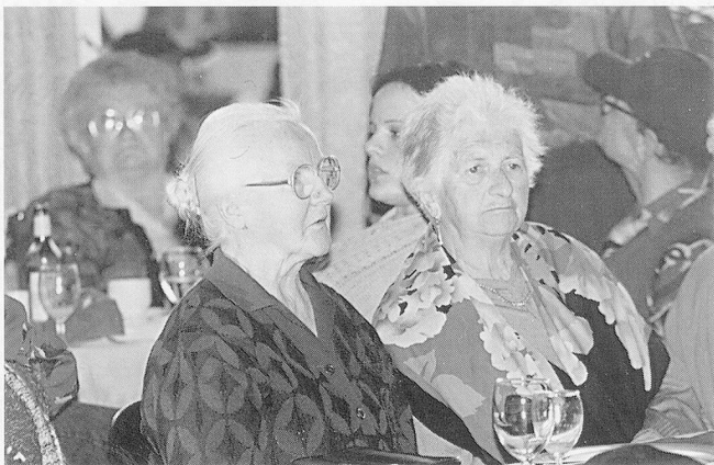
Senioren der Pflege- und Altersheime Thusis und Domleschg besuchen das HTF-Schulhotel in Passugg.

pd. Die Hotel- und Touristikfachschule (HTF) Chur hat Mitte März 1998 ihren Erweiterungsbau in Passugg bezogen. Als Auftakt zu diesen Eröffnungsfeierlichkeiten hat die HTF neulich die Bewohnerinnen und Bewohner der beiden Pflege- und Altersheime Thusis und Fürstenaubruck zu einem gemütlichen Nachmittag ins Schulhotel Passugg eingeladen.