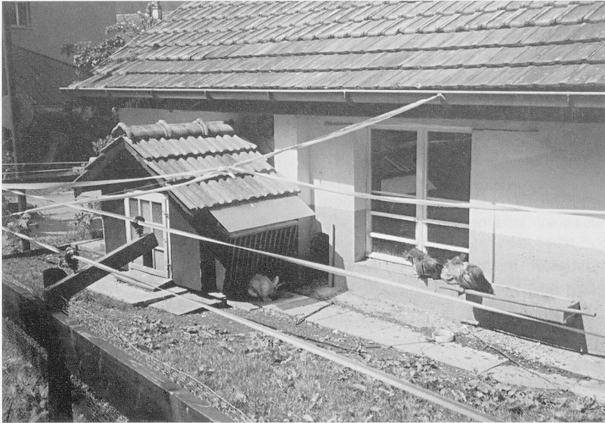
Das Kleintiergehege musste mit Bändern gegen den Habicht und mit einem stabilen Zaun gegen Zwei- und Vierbeiner aller Art geschützt werden.

Ebenfalls zu den Aufgaben der Hauswarte gehören Reinigungsarbeiten mit schweren Maschinen, das Putzen schwer zugänglicher Fenster, aber auch Chauffeurdienste für Bewohner, die zum Beispiel ins Spital oder zum Arzt gehen müssen.