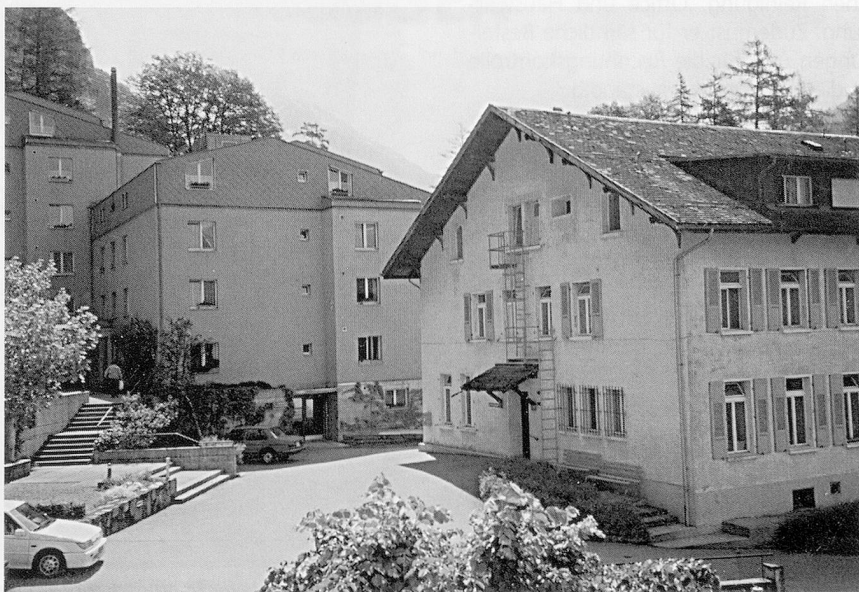
Blick vom Balkon des neuen Haupthauses auf das älteste Gebäude der Institution, das «Lenggasshüüs» (rechts) und auf die Wohnsiedlung mit 24 Alterswohnungen.