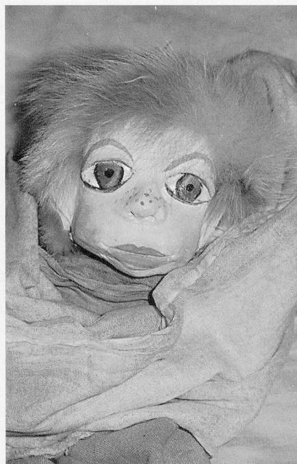
Altersarbeit mit Puppen (v.l.n.r.): Die Prinzessin wurde von einer 75-jährigen, geistig behinderten Frau als Patientenarbeit gefertigt; die Biografie-Puppe entstand als Semesterarbeit, und das allerliebste Puppengesicht gehört wiederum zu einer Patientenarbeit.