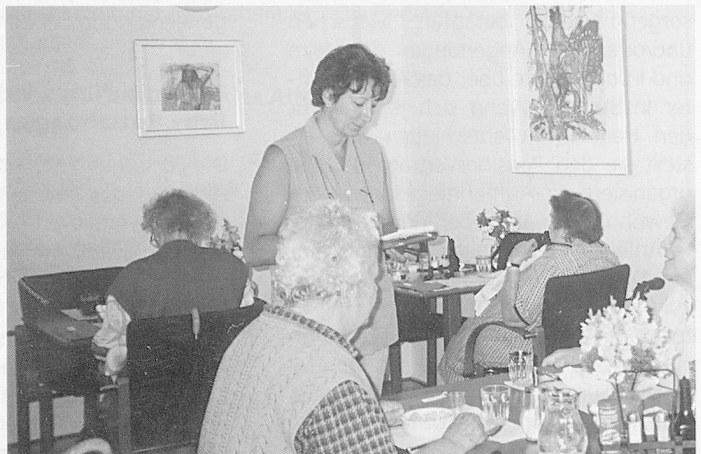
Die Fürsorgerin hat für Sorgen und Anliegen der Bewohnerinnen und Bewohner immer ein offenes Ohr.

Die Fürsorgerin nimmt an den Sitzungen des Stiftungsratsausschusses teil. Hier vertritt sie vorwiegend die Anliegen der Bewohnerinnen und Bewohner. Auch in der Baukommission, welche zur Zeit die zweite Etappe des Ausbaus der EAM – dieses Mal des Altersheimes – plant, besteht die Aufgabe der Fürsorgerin vorwiegend darin, frühzeitig die Bedürfnisse der Bewohnerinnen und Bewohner einzubringen. ■