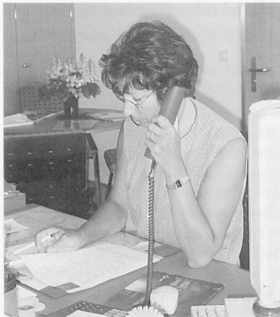
...und sorgt dafür, dass beim Eintritt sämtliche Unterlagen, Arztzeugnisse und allfällige Überweisungsrapporte vorliegen.

es der Fürsorgerin und der Oberschwester ein Anliegen, dass die Rahmenbedingungen mitberücksichtigt werden: «Neue» Bewohnerinnen und Bewohner sollten ihrer Meinung nach auch wirklich in die Institution und bei Zweibett-Zimmern zum zukünftigen Zimmernachbarn oder der -nachbarin passen. An den Sitzungen können die unterschiedlichen Sichtweisen dargestellt und diskutiert und wirtschaftliche, soziale und ethische Aspekte gegeneinander abgewogen werden, wobei die Entscheidung über die Aufnahme schlussendlich dem Heimleiter obliegt.